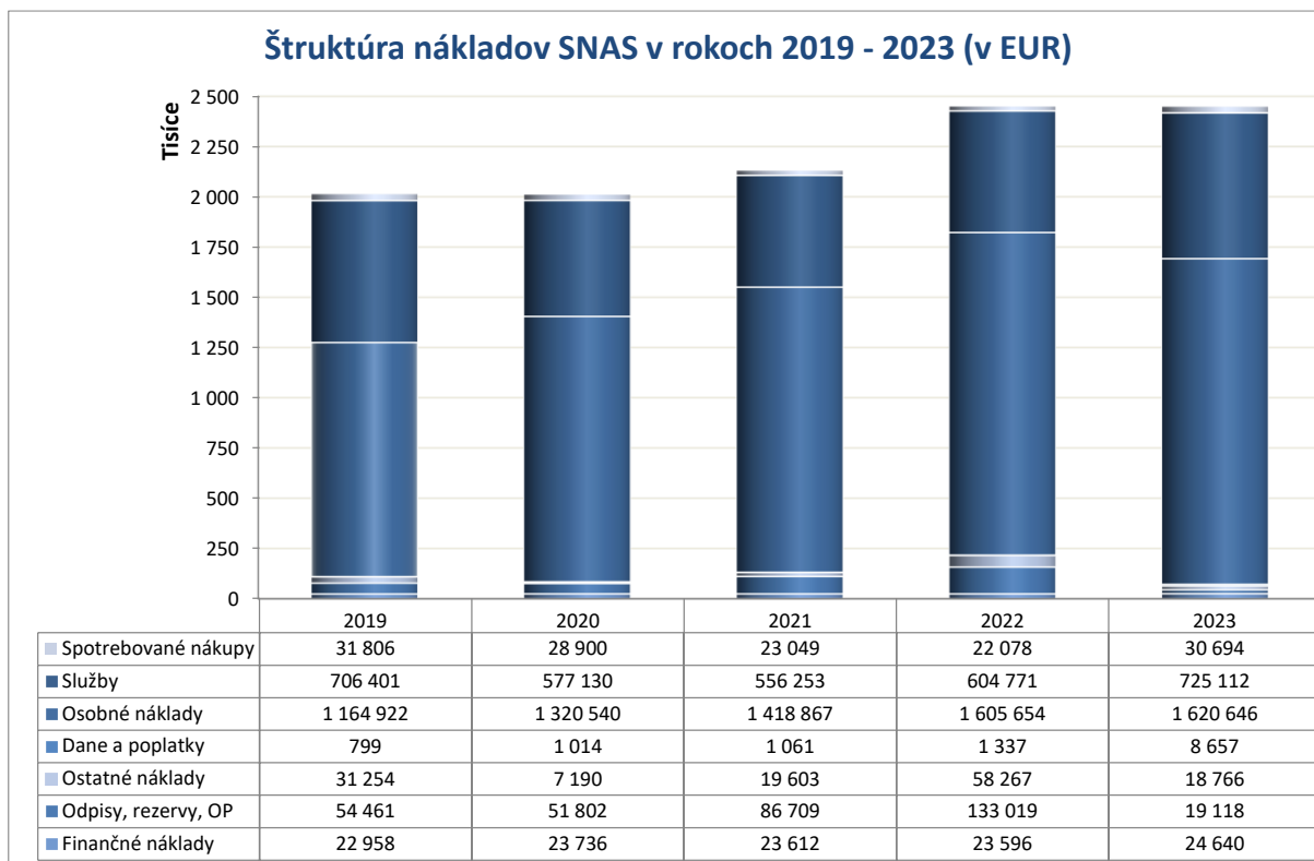
Štruktúra nákladov SNAS v rokoch 2019 - 2023 (v EUR)

Najvyšší podiel na nákladoch majú osobné náklady (66 %), ich podiel sa v uplynulom roku oproti predchádzajúcemu obdobiu nezmenil. Podiel služieb na celkových nákladoch predstavuje 28 % (30 % v roku 2023, 25 % v roku 2022). Odpisy dlhodobého majetku predstavujú 1 %. Spotrebované nákupy sa v roku 2024 podieľali na nákladoch 3 %.